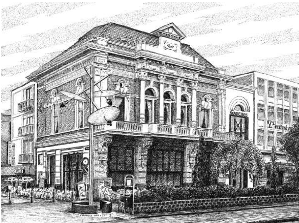
Pentekening Grand Café Riche : Dick Caderius van Veen

Geheimen onthullen zich makkelijker en de meest persoonlijke gevoelens of gedachtes komen rechtstreeks bij de toehoorder terecht zonder dat de spreker zich ongemakkelijk hoeft te voelen.